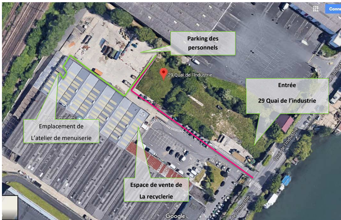
FIGURE 2 ACCES PARKING (ROUGE) ET ATELIER (VERT)