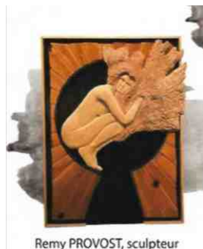
Remy PROVOST, sculpteur